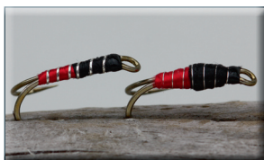
Watson's Fancy púpa