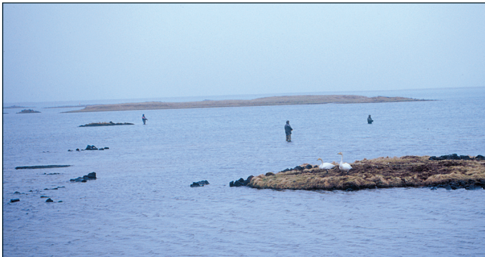
Áltir við hreiður

Notið ímyndunaraflíð og reynið eitthvað nýtt. Enginn skyldi fara eftir þessum leiðbeiningum mínum í blindni en ég vona hins vegar að þær geti orðið grunnur að ánægjulegri veiðiferð. Góða skemmtun!