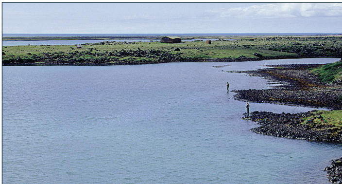
Botnavík horft til Réttarness