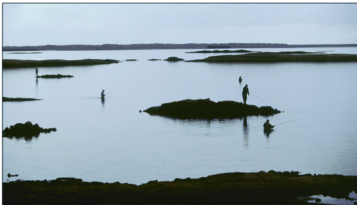
Í Girðingarvík og við Girðingarenda

skvompur í botninum þar sem skerir standa næstum upp úr á milli og talsverð hætta er á festum. Í norðri eða norðvestri frá réttinni sjálfri eru tveir hólmar rétt við landið. Oft gera álfarhjórn sér hreiður í stærri hólmanum sem nær okkur er og best er að láta þau í friði. Út af báðum hólmunum er mikil fiskivon. Það má vaða beint út í þann sem nær er, en ekki er vel fært úr honum yfir í hinn nema að taka land á milli. Hvort tveggja mjög góðir staðir og þá ekki síst í austanátt. Þetta eru þeir staðir sem menn ganga helst að við Réttina en vel er reynandi á öllum tögum og grynningum út af henni.