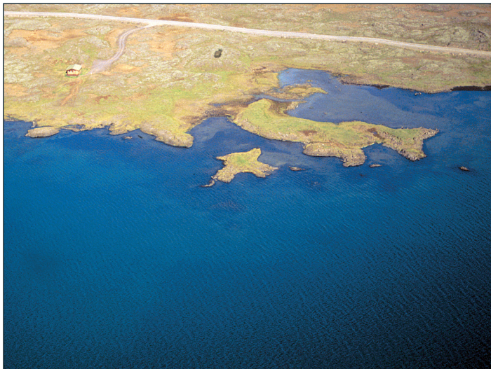
Forarvíkshólmar / Stvf. Selfoss